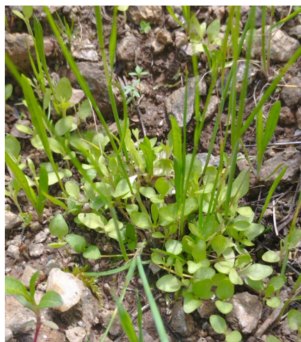
Semis de gentiane sous couvert de triticales – mai 2024

Malgré une forte densité de gentiane par endroits, il est à noter qu'en ce mois de mai, le cycle végétatif de la plante ne fait que commencer et que la masse foliaire va encore augmenter dans les semaines à venir.