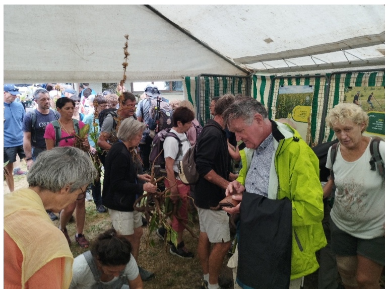
Animation et exposition Gentiane - Picherande - août 2024