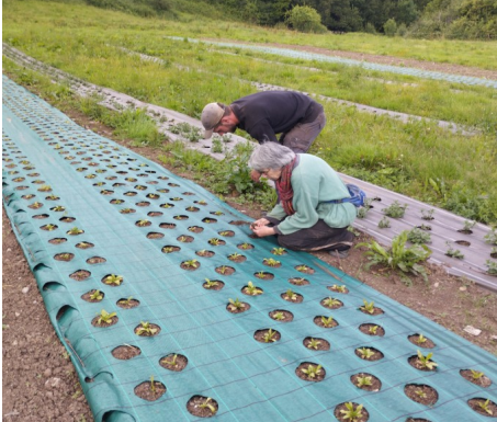
Essai de culture sur bâche - Loïc GENTET - juin 2024

consacré au désherbage est fortement réduit par rapport à une culture classique. Vu la petite taille de l'essai, ce temps n'est pas complètement représentatif. En effet, à plus grande échelle il faudrait revoir à la baisse la proportion du temps passé pour le travail du sol (attelage des outils, ...).