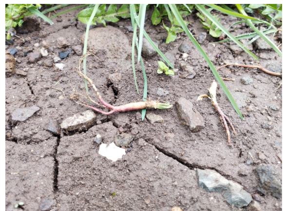
...Jusqu'à « expulsion » complète

phénomène impressionnant, probablement lié à la nature du sol et au gel / dégel. Sur sa plantation avec bâche en inter-rangs, Ines CHAUD-ULLRICH (Gelles-63740) poursuit la notation de son temps de travail : 25 h au total / 50 m 2 pour la première année. Elle précise que l'achat de la toile tissée a un coût, mais que le temps