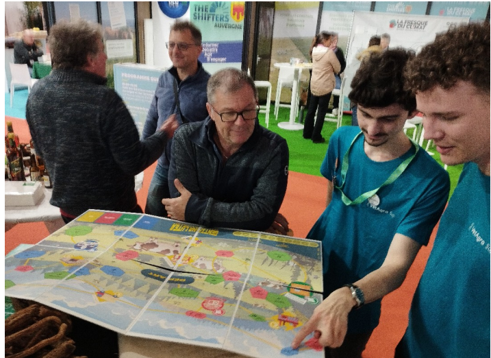
Présentation du jeu destiné aux professionnels - Sommet de l'Élevage - octobre 2024

Afin de faire vivre ces jeux et de répondre au mieux aux sollicitations, l'association décide de tester les prototypes existants durant un an, avant d'étudier la possibilité de les éditer. Pendant cette période, les jeux seront répartis entre l'association Anis Étoilé*(un exemplaire de chacun des trois jeux), et l'association (deux jeux grand-public qui pourront circuler parmi les adhérents, sur demande). L'association se garde la possibilité de récupérer ponctuellement l'ensemble des jeux pour animer les événements auxquels elle participe. Il est prévu de mettre en place des conventions de prêts avec nos partenaires. La réalisation d'un questionnaire est également envisagée.