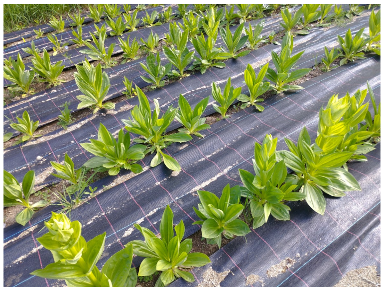
Culture de gentiane avec bâche en inter-rangs - culture de 1 an très bien développée

La sortie se termine par la visite de la pépinière : les plants issus de la production de Christian PERRIER avec une levée de dormance à l'acide gibbéréllique (AG3*) ont été repiqués au jardin, ils sont beaux. Quelques jeunes plants prélevés lors de la récolte de la culture du Monestier (octobre 2023) ont été mis en jauge dans le jardin, ils sont beaux aussi. Une autre série de plants prélevés lors de la récolte du Monestier a été repiquée en godets. Nombre d'entre eux n'ont pas survécu, vraisemblablement à cause de l'habillage des racines qu'a nécessité le repiquage. Les plants vivants ne se sont pas développés. Les plants commandés à Centa Kirsch, livrés le 25/05 et en attente de répartition entre les adhérents de Gentiana Lutea sont beaux mais encore fragiles. On peut observer un problème de pourriture en bordure des caisses.