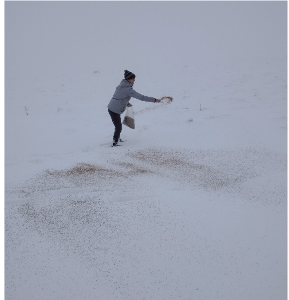
Semis de gentiane à Cheylade - décembre 2024

Essai 4 : sur-semis 2024-2025 + plantation de plants racines nues (prévue en mai 2025). Le semis de la modalité A est réalisé en début d'hiver : le 26/11/2024 au Signal du Luguet, le 03/12 à Lalcam et le 10/12 dans 20 cm de neige à Cheylade.