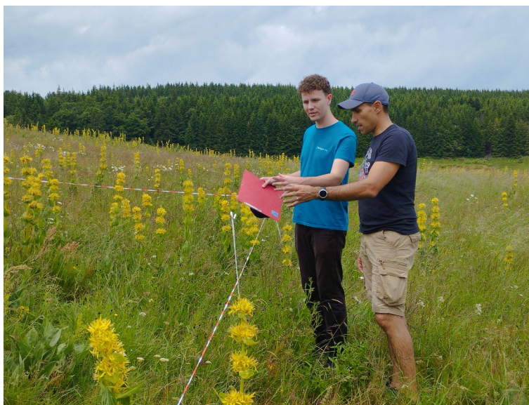
Comptage de gentiane - Anzat-le-Luguët - juillet 2024