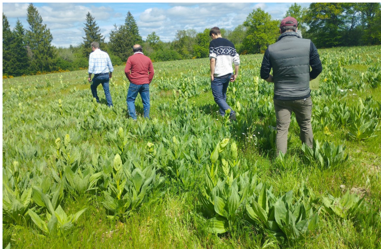
Visite d'une parcelle en culture - Bourg-Lastic – mai 2024

Semis 2024 : sous un couvert de triticales (pas très dense et d'une hauteur d'environ 30-40 cm), les plantules de gentiane semées en mars sont bien visibles (1 cm environ). La ferme est en conversion en AB, ce qui implique une réflexion sur l'entretien de la parcelle en année 2, lorsque la céréale protectrice aura été fauchée.