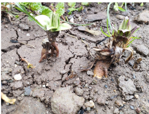
Déchaussement de plants de gentiane