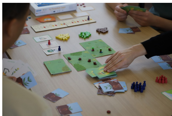
Conception de jeux sérieux – GAMAE / VetAgro Sup - mars 2024