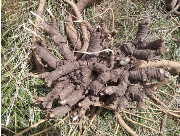
Rhizome visiblement âgé mais tortueux et peu développé. Présence de nombreux bourgeons

Dans le contexte actuel de baisse de la ressource, ces relevés ont pour objet d'actualiser le guide de bonnes pratiques de production de racine de gentiane et de travailler sur des préconisations objectivement contrôlables. Nous tentons par exemple de transformer un taux de prélèvement maximum en nombre de plants à laisser en place, ce qui prémunie aussi d'autres exploitations dans les années suivant la récolte. Nous souhaitons également avoir une idée plus précise de la masse moyenne d'un pied exploitable (actuellement de 1 kg selon notre guide de bonnes pratiques).