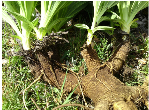
Gros rhizome a priori moins âgé que sur la photo précédente. Peu de bourgeons mais grosses rosettes

Concrètement l'auditeur pèse 10 plants (partie souterraine) au fil de l'arrachage. Ce ne sont pas forcément les plus gros plants qui sont choisis, mais les plus représentatifs de ce qui est réellement exploité sur chaque chantier. La masse moyenne des plants exploités en 2023 (sur 2 chantiers) est de 1455 gr. Elle est de 1757 gr en 2024 (sur 4 chantiers). Vu le peu de chantiers encore audités, ces données ne peuvent être considérées comme représentatives. Elles donnent cependant une idée de la taille des plants aujourd'hui exploités et montrent une importante hétérogénéité entre les sites (masse ou morphologie de la partie souterraine de la plante).