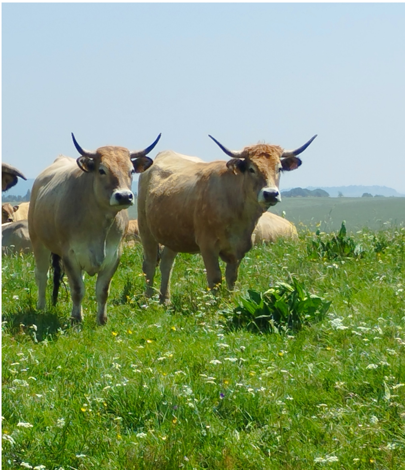
Cohabitation vaches / gentiane - Lacalm (12) - juin 2025

Stéphanie Flahaut – chargée de mission Gentiane