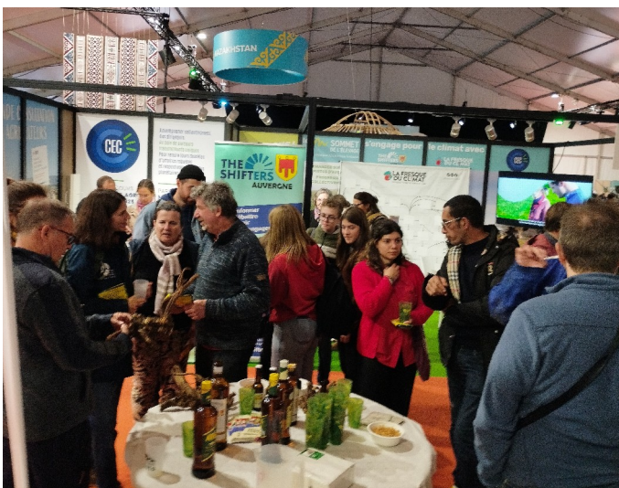
Animation Gentiane sur le stand des Rencontres pasto - Sommet de l'Élevage 2024

Par le biais de la formation des futurs éleveurs, nous avons par ailleurs présenté la filière et abordé la problématique de gestion de la ressource avec une classe de BTS-PA* production animale de Limoges en voyage d'étude au Mont Dore - 63240 (le 02/10).